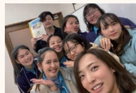
▲過去開催した研修の様子