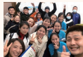
▲過去開催した研修の様子