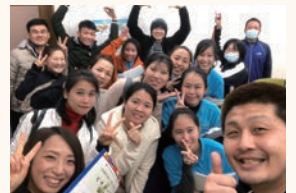
▲過去開催した研修の様子